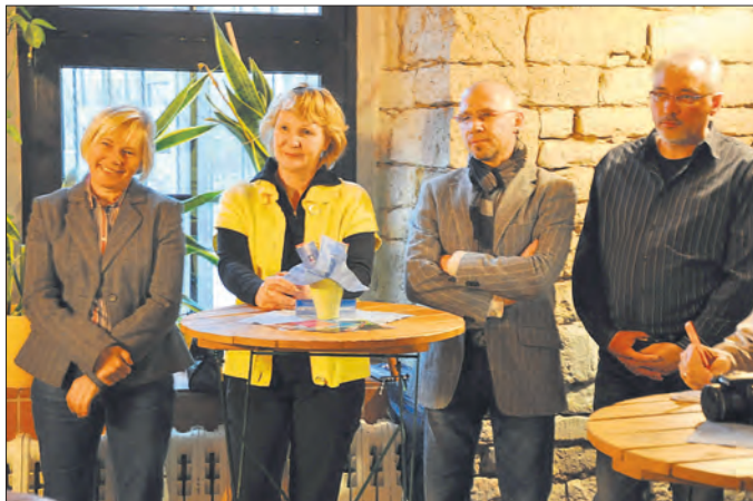
ufmerksame Zuhörer aus den Bereichen Politik, Wirtschaft und Verwaltung bei der Präsentation des Bildungsberichts.